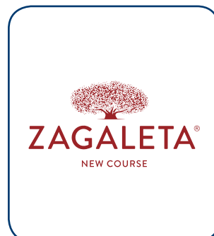
La Zagaleta - New Course MÁLAGA - ESP