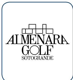
Almenara Sotogrande CÁDIZ - ESP