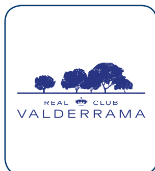
Real Club Valderrama CÁDIZ - ESP