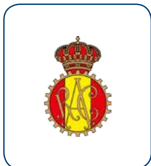
RACE Golf MADRID - ESP