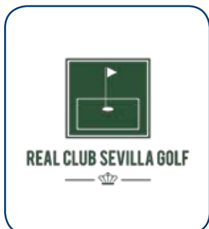
Real Club de Golf de Sevilla SEVILLA - ESP