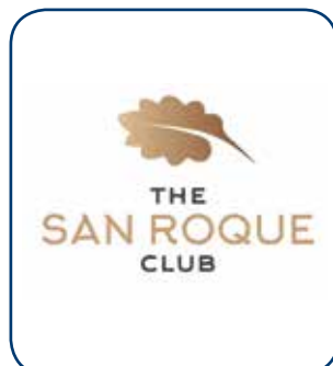
San Roque Club CÁDIZ - ESP