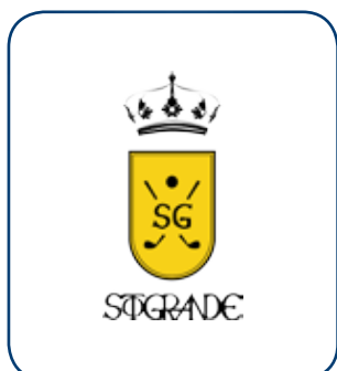
Real Club de Golf Sotogrande CÁDIZ - ESP