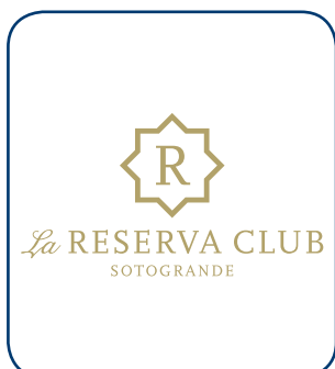
La Reserva Sotogrande CÁDIZ - ESP