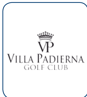
Villa Padierna MÁLAGA - ESP