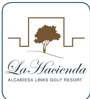
Alcaidesa Links CÁDIZ - ESP