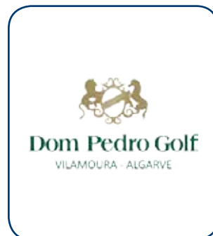
Dom Pedro VILAMOURA - POR