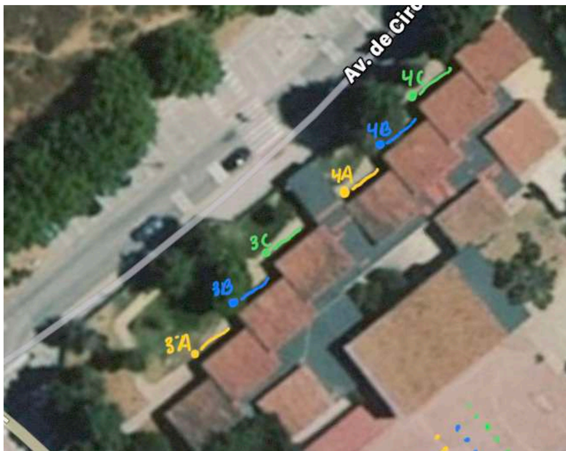
Zona espera 3º ciclo